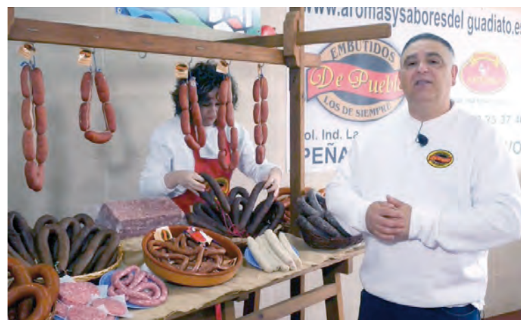
diato.com, donde cada embutido cuenta una historia de amor por la gastronomía y el legado familiar que perdura en el tiempo.

No te pierdas la oportunidad de sumergirte en este viaje gastronómico a través del vídeo en Infogua-