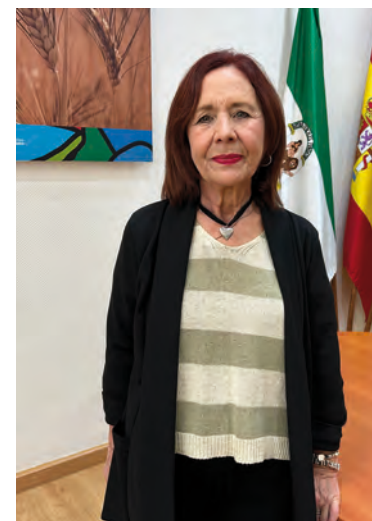
Pozuelo explicó las actuaciones que se están realizando

Desde el consistorio han hecho un llamamiento para tratar de localizar a los familiares de los dos represaliados, por lo que si alguien tiene información al respecto, puede ponerse en contacto con la concejala de Memoria Democrática en el teléfono 628 022 796.