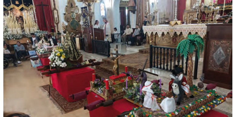
Procesión CEIP Eladio León Imágenes