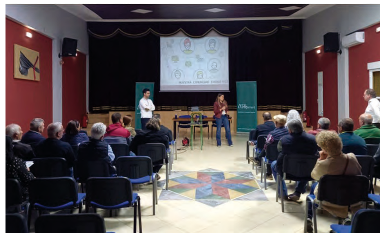
Acto en el que se presentó la comunidad energética

La Cooperativa Energética de La Granjuela busca democratizar el ac-