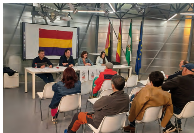
Ponentes de este acto

La Marcha Republicana del 16J se presenta como un evento crucial