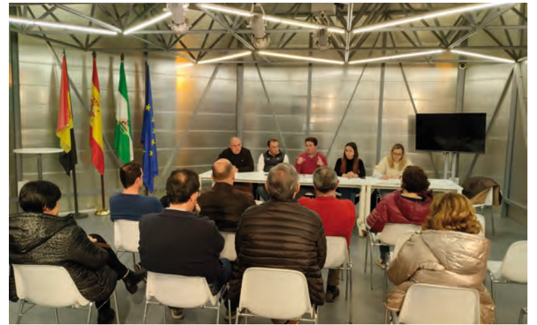
Asistentes a la asamblea celebrada por la asociación empresarial

Entre los proyectos que la asociación tiene en marcha se encuentra el proyecto Impulso Digital para el Guadiato, un proyecto de digitalización integral diseñado para capacitar a nuestra comunidad en el uso efectivo de la tecnología, ofreciendo soluciones personalizadas y acompañamiento continuo en todo el proceso de digitalización. Consiste en una app gratuita con la cual se consigue incentivar los