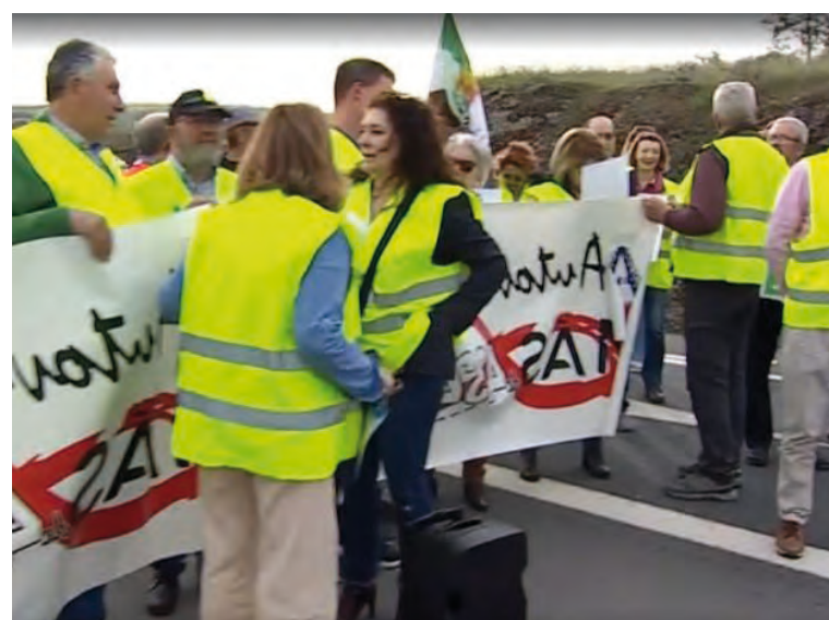
Un momento del corte de la carretera a la altura de Berlanga

A esto se une la motivación económica, ya que no es lo mismo para las empresas tener acceso a una autovía que a una carretera nacional.