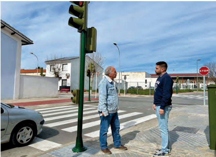
Semáforos que se han instalado en la zona de conexión de las rondas norte y sur