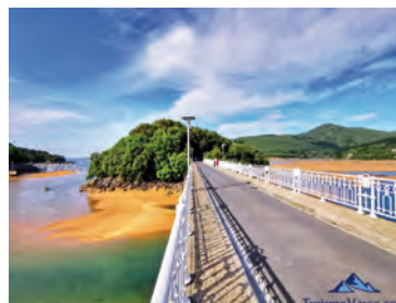
Isla de Txatxarramendi Sukarrieta Urdaibai

Refiriéndome a los trenes vascongados que se desplazan desde distintos puntos de la geografía vasca, una de las líneas va desde Bilbao a Bermeo. Casi llegando a este último se encuentra la estación de Pedernales-Busturia, localidad altamente veraniega, que duplica o triplica su población en el verano. En esa estación estaba destinado mi padre, y junto a ella, mediante el paso a través de un puente se accede a la isla de Chacharramendi, situada en la desembocadura del río Oka, en la Ría de Guernica y forma parte de la Reserva Natural de Urdaibai. El lugar es paradisíaco, y consecuentemente invito a investigar y ampliar datos en el famoso Google. Pasamos una maravillosa tarde viendo el ajetreo de viajeros y desde la pequeña isla mencionada pudimos observar el famoso peñón de la isla de Ízaro, famo-