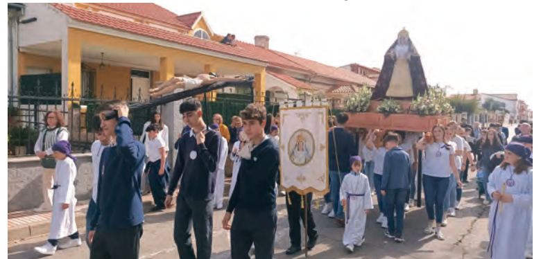
Procesión Colegio Presentación de María Crucificado y Candelaria

ñándolos a la guitarra él mismo y Coral Díaz, interpretando marchas como "Virgen de los Estudiantes", dedicada a todos los alumnos y alumnas del Colegio, "Hermano Costalero", "Pasan los Campanilleros", entonada solamente a caja, guitarra y violín, cerrando con "Encarnación Coronada" con todos los presentes, grandes y pequeños puestos de pie, cantando la salve final. El acto finalizó, con la entrega de un pequeño incensario a la directora del colegio por parte de