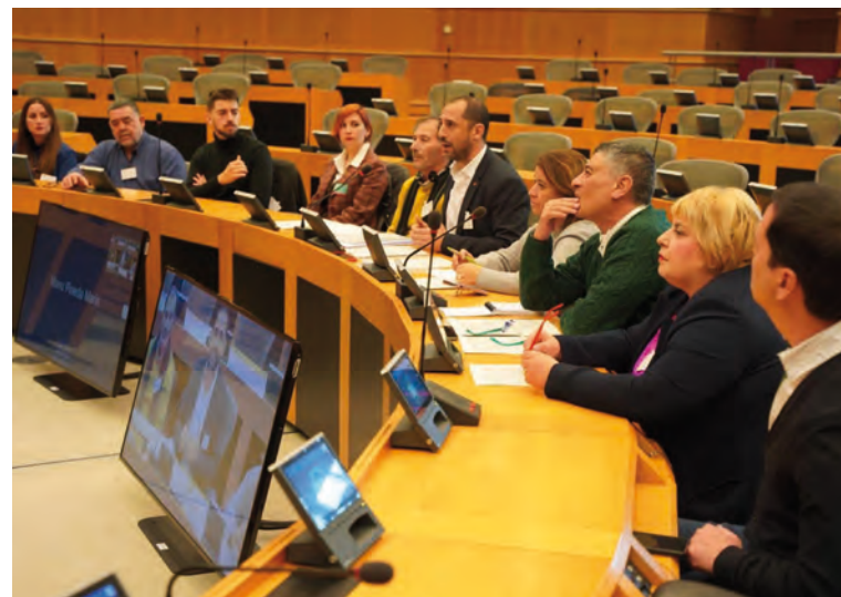
Representantes de IU en el Parlamento Europeo