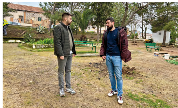
El consistorio va a mejorar este parque

Asimismo, la actuación contempla la instalación de agua potable para el riego, y de la red de saneamiento para la recogida de agua pluviales, incluyendo la colocación de imbornales.