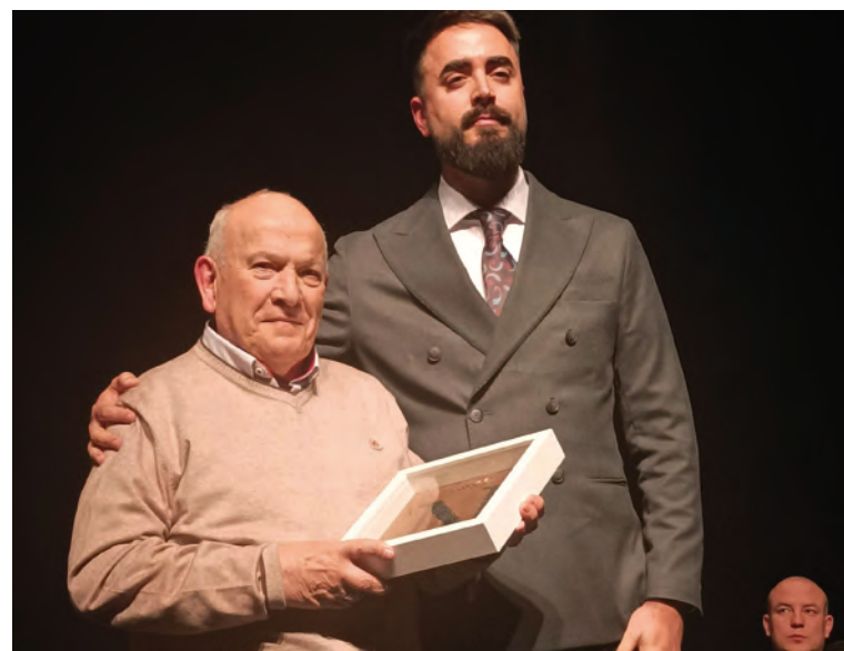
preparando para el mes de Julio a Mina Santa Rosa, de lo que informaremos a su debido momento. realizar como el año pasado en la