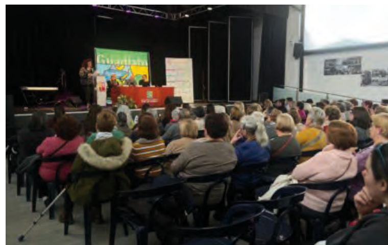
Uno de los momentos del acto

textos de Federico García Lorca, esta representación realiza un alegoría del Feminismo a través de la sonoridad de las canciones populares que utilizaba Lorca en sus obras, y de un texto en el las mujeres escapan de los dramas y defienden su libertad. La obra tuvo una excelente acogida por parte de los asistentes, resultando, su temática, muy acorde con el día que se estaba celebrando. Terminó la jornada con una convivencia entre todos los asistentes aderezada con chocolate y bizcochos.