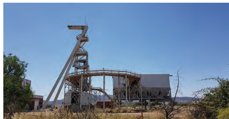
Vista del pozo María

El objetivo de este proyecto es la puesta en valor del patrimonio minero-industrial asociado al carbón de las zonas de transición justa para que sirva como base para la creación de una experiencia turística innovadora y sostenible.