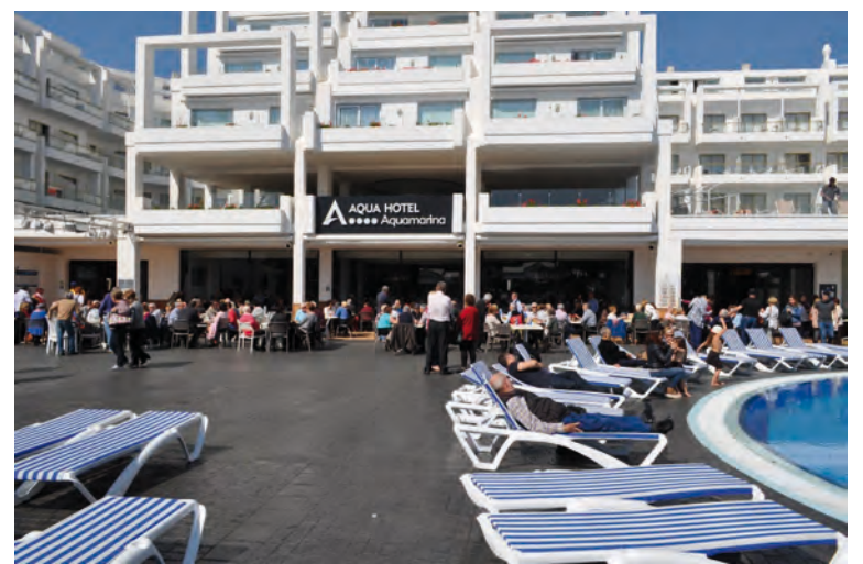
Asistentes a uno de los anteriores encuentros de peñarriblenses

Más que un simple evento, el Encuentro de Peñarriblenses es un tributo a nuestra historia, una celebración de nuestras tradicio-