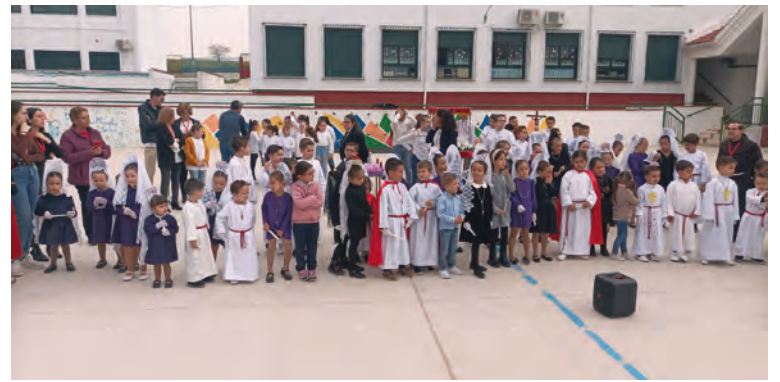
Procesión CEIP Aurelio Sánchez