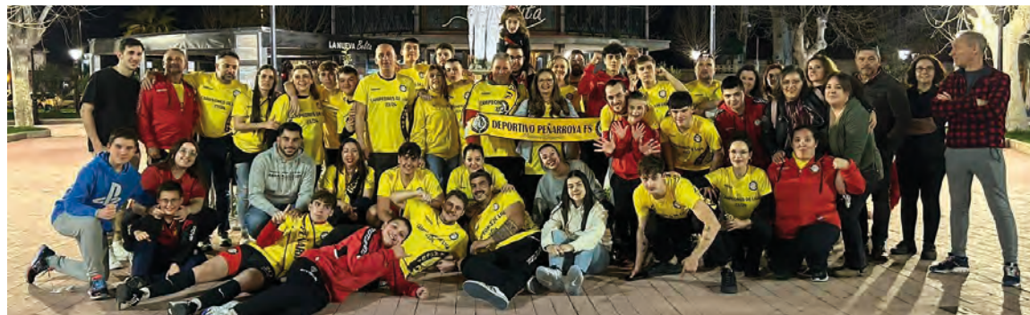
Equipo Juvenil FS y familiares tras quedar campeones de la 2ª Andaluza