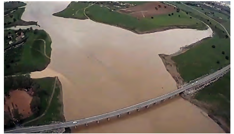
Puente del Mariscal en Peñarroya, majestuosamente erguido sobre las aguas del embalse de Sierra Boyera

mejoras de carreteras, los planes alternativos a la desindustrialización del Guadiato, los hospitales, la parada de trenes de alta velocidad, evitar la instalación de un ce-