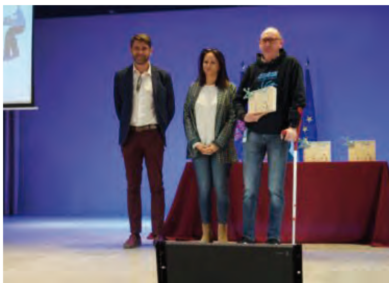
La Asociación Astronómica de Piconcillo fue una de las premiadas

Asimismo, se han entregado los Premios a Proyectos Innovadores con Impacto Social, obteniendo el primer premio Industrias Gregasa S.C.A. (Fuente Obejuna), con una amplia experiencia en el sector de la reparación de plásticos, carrocería y pintura de automóviles con la aplicación de las más avanzadas tecnologías y el segundo Fundación Prode (Pozoblanco), que lleva más de 40 años mejorando la vida de las personas con discapacidad gracias a su amplia cartera de servicios y de actividades. El resto de finalistas han sido Transformando SCA, Metalúrgicas Lozano SL, DS Smith Packaging Lucena, Glamping La Dehesa, Ideas y Asociación La Fresnedilla.