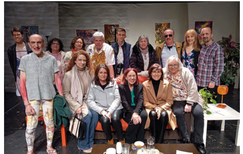
Actores del grupo de Teatro La Tarima

A lo largo de las dos horas que duró la obra, el público asistente se lo pasó a lo grande ante los diálogos y los enredos originados por el elenco de actores, pero principalmente por Juan el taxista y su amigo Paco, ante las preguntas que le hacían el resto de personajes y la propia policía que no terminaban de entender las ocurrencias que se le iban ocurriendo a estos dos personajes para salvar la doble vida que llevaba Juan, casado con dos mujeres diferentes y viviendo con ellas en sus respectivas casas, cada una en un barrio distinto. Todo ello le obligaba a llevar una planificación de horario muy estricta y hacer verdaderos juegos malabares para poder contentar a am-