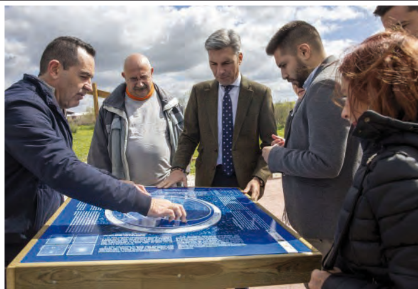
Punto de Observación Estelar inaugurado en Peñarroya-Pueblonuevo

una base de hormigón y un remate de pavimento ejecutado con mortero coloreado. En el centro se ha realizado una rosa de los vientos orientada a los puntos cardinales y cada punto cardinal se ha dotado de una suave iluminación solar de orientación. El punto se encuentra rodeado en tres de sus lados por banquetas de madera y en su entrada se han colocado dos atriles interpretativos de las constelaciones estelares.