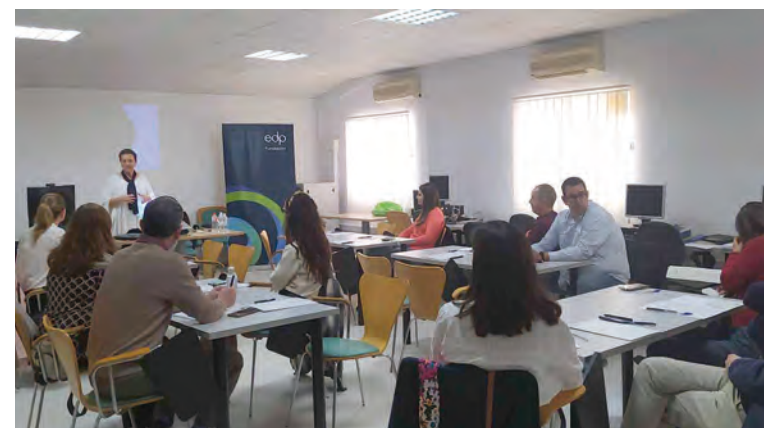
Uno de los momentos de la actividad formativa

Cada proyecto puede recibir hasta 100.000 €, representando como máximo el 50 % del presupuesto total para propuestas empresariales o gubernamentales, o el 75 % para proyectos sin ánimo de lucro. En el caso de consorcios integrados por