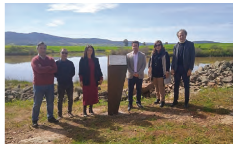
Acto de presentación de la placa